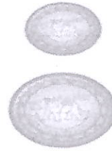
ดุสิตราชมหาวิทยาลัย