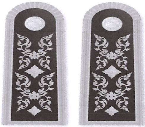
อินทระณู